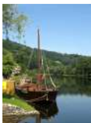
La gabare à Beaulieu-sur-Dordogne

Extrait de La Rivière Espérance, (Tome 1) , de Christian SIGNOL, aux éditions R. Laffont.