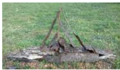
Notre gabare réalisée avec des écorces