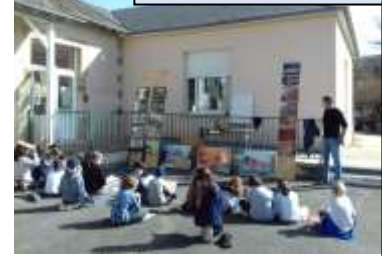
Les étapes de l'assemblage :