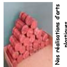
Nos réalisations d'arts plastiques