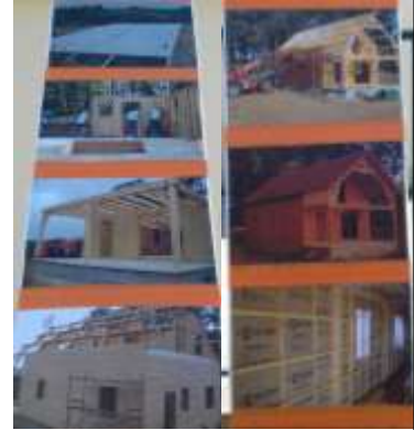
Un chalet (vue extérieure) :