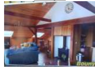
Autres exemples de chalets :